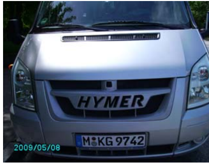
Das WoMo vor Antritt der Fahrt