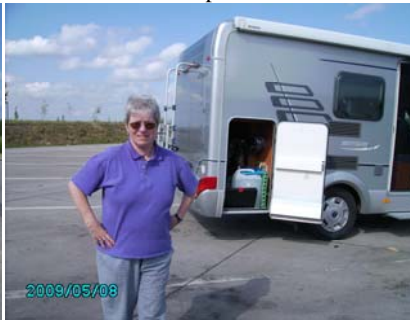
Rast an der BAB