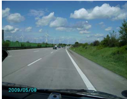
Windpark an der BAB Leipzig