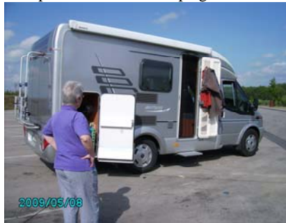
Rast an der BAB