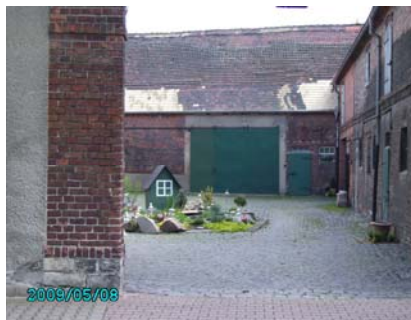
Blick in einen Innenhof