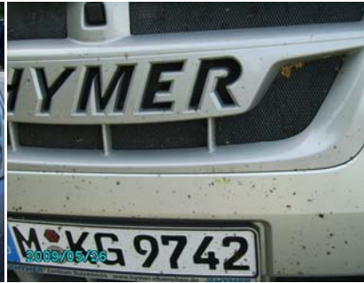
... und dann am letzten Tag