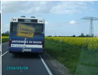
Umleitung Landkreis Leipziger Land = wegen Stau dort gefahren