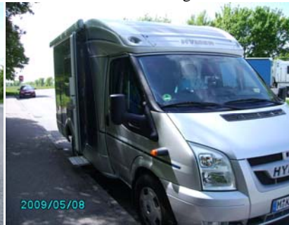
1. Rast ...andere Seite