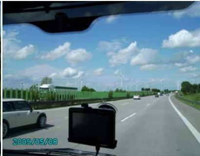
Unsere Tussi = 1. Copilotin